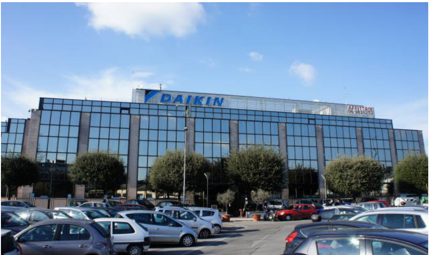
Esterni (via della Maglianella)

Indirizzo: Via della Maglianella, 65R/65T - 00166 Roma